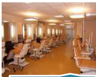
Soin du Corps