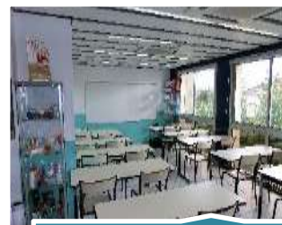
Salle de théorie