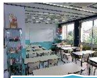
Salle de théorie