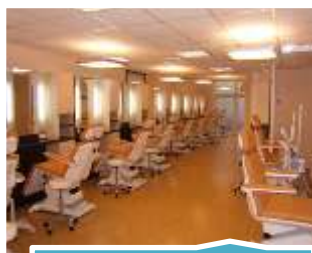
Soin du Corps