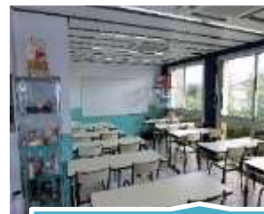
Salle de théorie