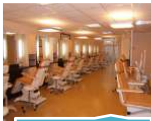
Soin du Corps